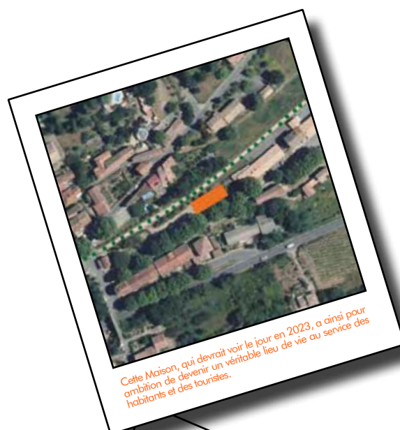
Cette Maison, qui devrait voir le jour en 2023, a ainsi pour ambition de devenir un véritable lieu de vie au service des habitants et des touristes.

Le 27 juillet, une première réunion de travail avec le maître d'œuvre a permis aux futurs utilisateurs du bâtiment d'affiner leurs attentes.