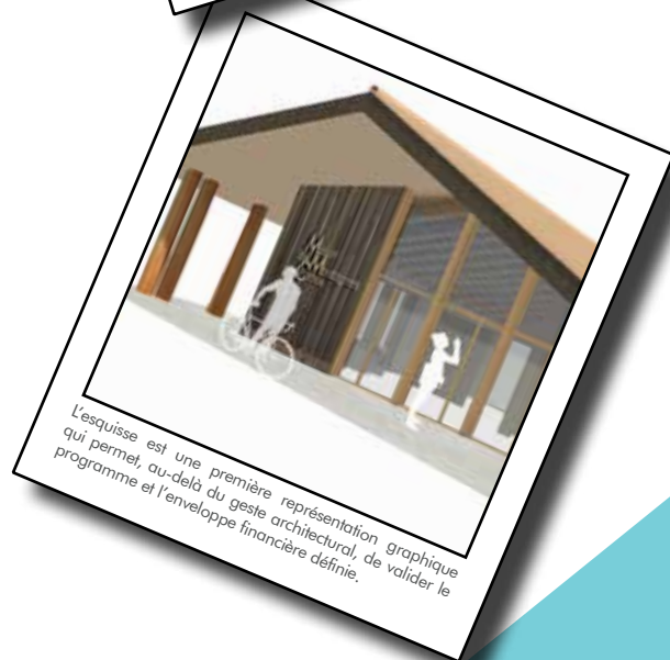
L'esquisse est une première représentation graphique qui permet, au-delà du geste architectural, de valider le programme et l'enveloppe financière définie.

La Maison des Montagnes du Caroux est cofinancée par l'Union européenne, la Région Occitanie et le Département de l'Hérault, ainsi qu'une participation de La Poste pour l'agence postale