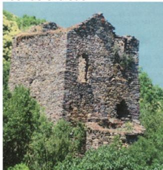
Tour du château