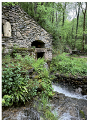
Bord de la Cesse

Si vous n'êtes pas adepte de la randonnée, vous avez la possibilité de vous poser au roc Suzadou ou sur le bord de la Cesse (direction route de l'église)